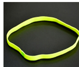
3. Opaska na głowę