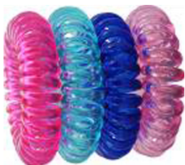
1. Gumka do włosów