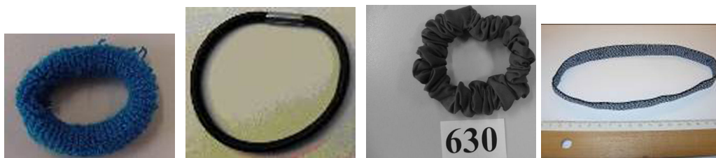
1. Gumka do włosów 2. Gumka do włosów 3. Gumka do włosów 4. Opaska na głowę