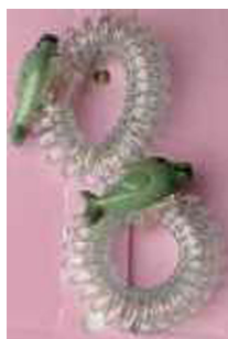
2. Gumka do włosów